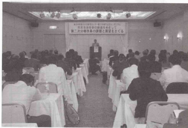
記念シンポジウムの様子

2007年6月4日をもって神奈川県地方自治研究センターが設立から30周年を迎えることを記念して、同日にワークピア横浜において「神奈川県地方自治研究センター30周年記念シンポジウム・レセプション」を開催いたしました。双方ともに100名を超える多くの方々にご来場いただきました。シンポジウムおよびレセプションの開催にご協力いただいた関係者のみなさまを含め、この場をかりまして御礼申し上げます。